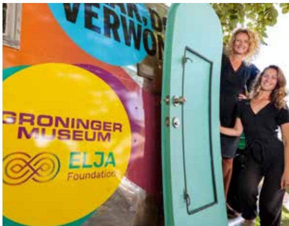
8. Bedrijf in beeld: Groninger Museum