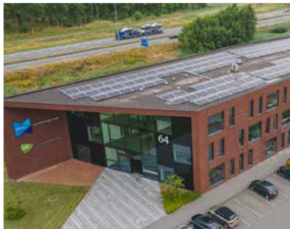
12. Duurzaam uitzenden