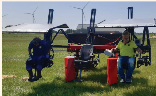
Aardappelselecteurs Wytse Bruining en Hans Scholthoorn

Een mooie bijkomstigheid van deze kar is dat deze niet alleen is voorzien van luxe stoelen, maar ook een radio en - niet geheel onbelangrijk - zonbescherming heeft.