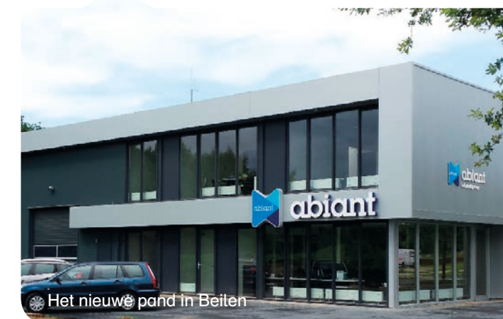
Het nieuwe pand in Beilen

De afgelopen periode zijn er een aantal verhuizingen geweest binnen Abiant. Zo is de vestiging in Beilen samen met Abiant EU-service verhuisd naar een gloednieuw pand aan de Ossebroeken 16 in Beilen en zijn Abiant Bouw en Abiant Techniek voortaan te vinden aan de Kieler Bocht 9D in Groningen. Kijk voor de volledige contactgegevens van onze vestigingen op www.abiant.nl/contact ◀