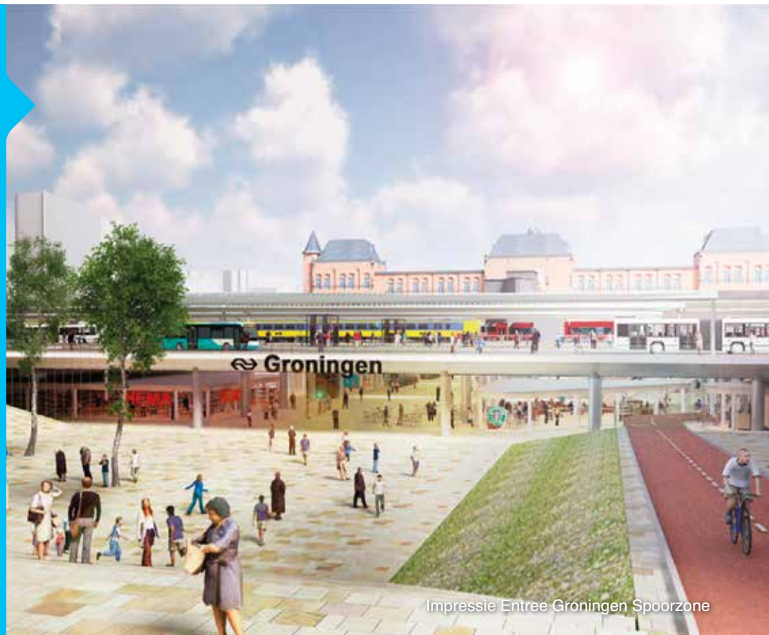
Impressie Entree Groningen Spoorzone